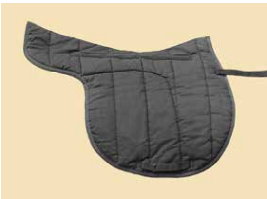
Xtra Thick Wool Fleece Schabracke sattelförmig

Damit die Schabracken ihre Funktion nicht verlieren, muss darauf geachtet werden, dass sie sauber sind. Die Pferdehaare müssen nach jedem Reiten raus gebürstet werden, damit sie sich nicht ins Fleece einarbeiten können. Nach dem Waschen die Schabracke trocknen und dann alle Haare sauber raus bürsten oder mit einem Staubsauger absaugen. Wir empfehlen dir, die Sattellage deines Pferdes vor dem Satteln gut zu reinigen. Die Schabracken sollten je nach Verschmutzung schon nach 3 bis 4 Ritten gewaschen werden. Um sie möglichst wenig zu waschen und so zu schonen, empfehlen wir, die Schabracken nach jedem Ritt trocknen zu lassen und anschliessend gut auszubürsten. Eventuell kannst du mit einem feuchten Tuch das Fleece etwas abwischen, um es sauber zu halten.