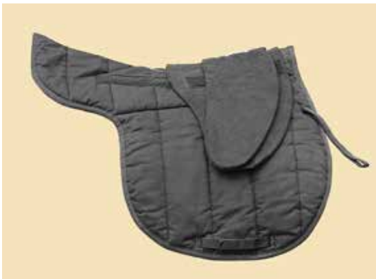
1/4' LJB unter einem 1/2' oder 1/4' JB