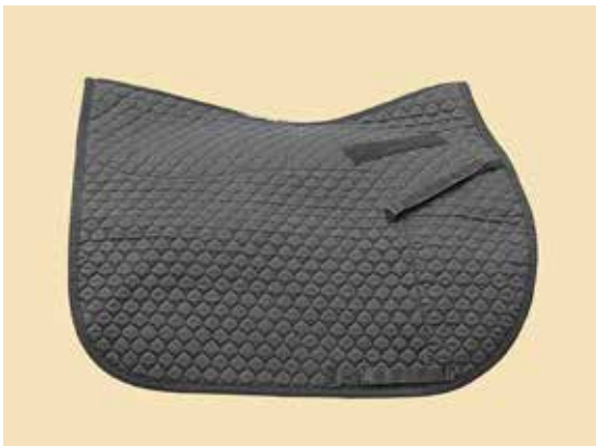
Wool Fleece Schabracke in viereckiger Form