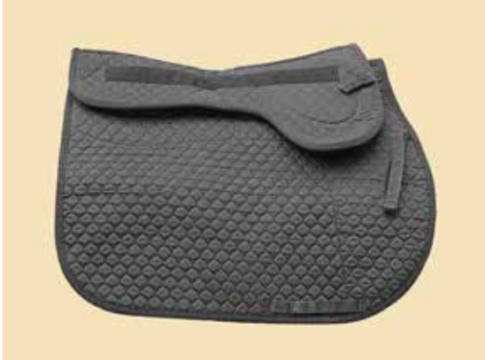
Wool Fleece Base Pad auf Schabracke

Das BALANCE Wool Fleece Base Pad ist Teil des BALANCE Sattel Systems. Diese Pads werden am besten unter Sätteln gebraucht, deren Sattelkissen Schaumstoff enthalten und genügend weit sind, damit die extra Schichten unterlegt werden können, ohne die Sättel aus der Balance zu bringen (und nach hinten tippen).