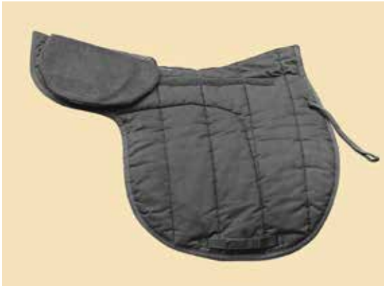
Remedial B 1/2'

Die runden kleineren Pads sind als Unterlage für hinten gedacht oder das Kleinste für die Mitte. Das