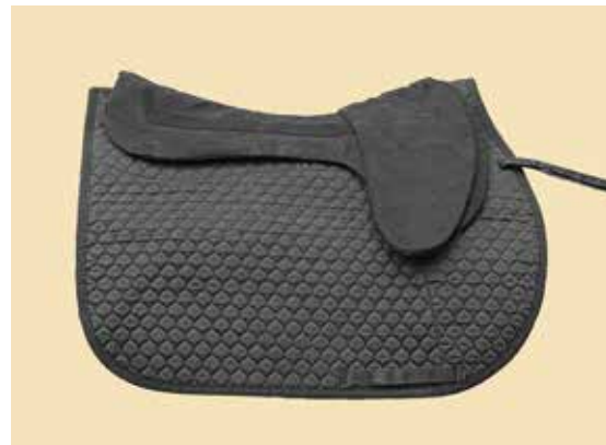
1/2' oder 1/4' JB auf einem Base Pad