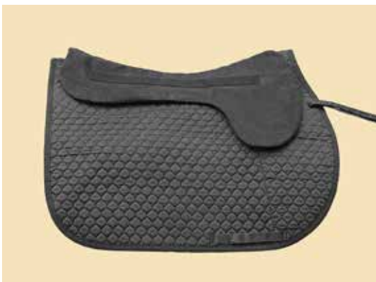
Pro Complete Base Pad in 1/2' oder 1/4' auf Schabracke

Das BALANCE Pro Complete Base Pad in 1/2' oder 1/4' ist Teil des BALANCE Sattel Systems. Diese Pads werden am besten unter Sätteln gebraucht, deren Sattelkissen mit Wolle geflockt und genügend weit sind, damit die extra Schichten unterlegt werden können, ohne die Sättel aus der Balance zu bringen (und nach hinten tippen).