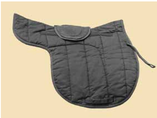
Remedial A Pad

Letztere ist ein Spezialpad und kommt beim Wiederaufbau eines Senkrückens zur Anwendung, es heisst Remedial A Pad. Die Remedial B Pads sind vor allem hinten zu unterlegen, um den Sattel auszubalancieren, falls er nach hinten kippt und damit der Reiter dem Pferd nicht zu fest im hinteren Teil des Rückens sitzt. Auch kann es Reitern helfen, die tendenziell im «Stuhlsitz» auf dem Pferd sitzen.